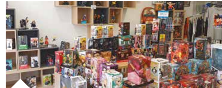
Pop-culture - Geek O'Sphère 13 Grande rue - 09 83 69 33 88