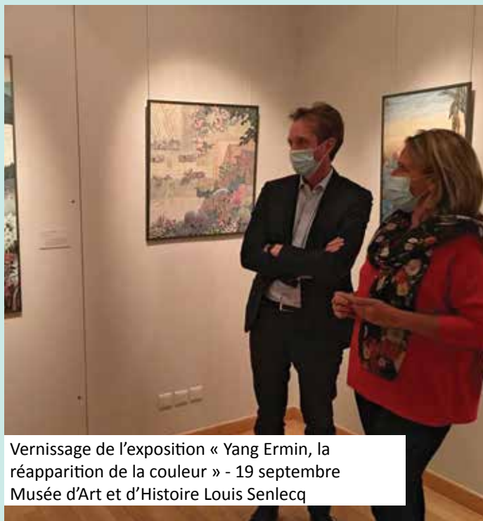
Vernissage de l'exposition « Yang Ermin, la réapparition de la couleur » - 19 septembre Musée d'Art et d'Histoire Louis Senlecq