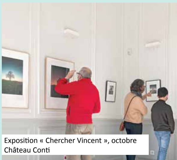
Exposition « Chercher Vincent », octobre Château Conti