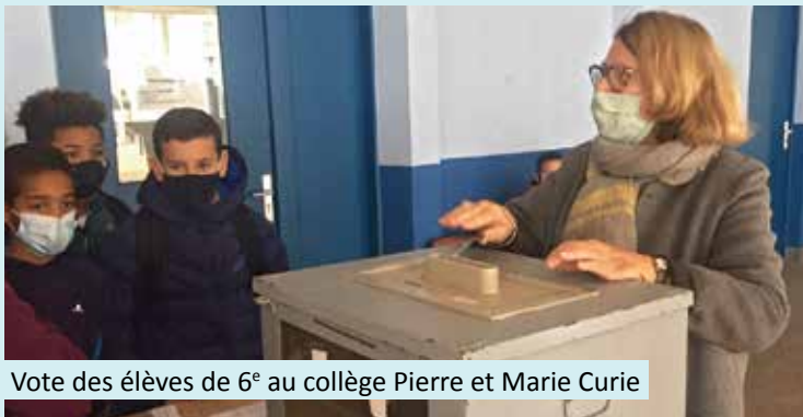
Vote des élèves de 6 e au collège Pierre et Marie Curie

« C'est en équipe et avec des personnes qui incarnent toute la diversité de notre Ville que nous avançons dans le sens de l'intérêt général ». C'est pourquoi le Maire s'est entouré de deux Conseils nouvellement installés : le Conseil Municipal des Jeunes, pour son regard neuf sur la ville et sa force de propositions et le Conseil des Sages pour son expérience et son savoir. Deux équipes dont la vision et les conseils sont précieux et sur lesquels l'équipe municipale pourra s'appuyer afin d'affiner ses décisions et projets tout au long du mandat.