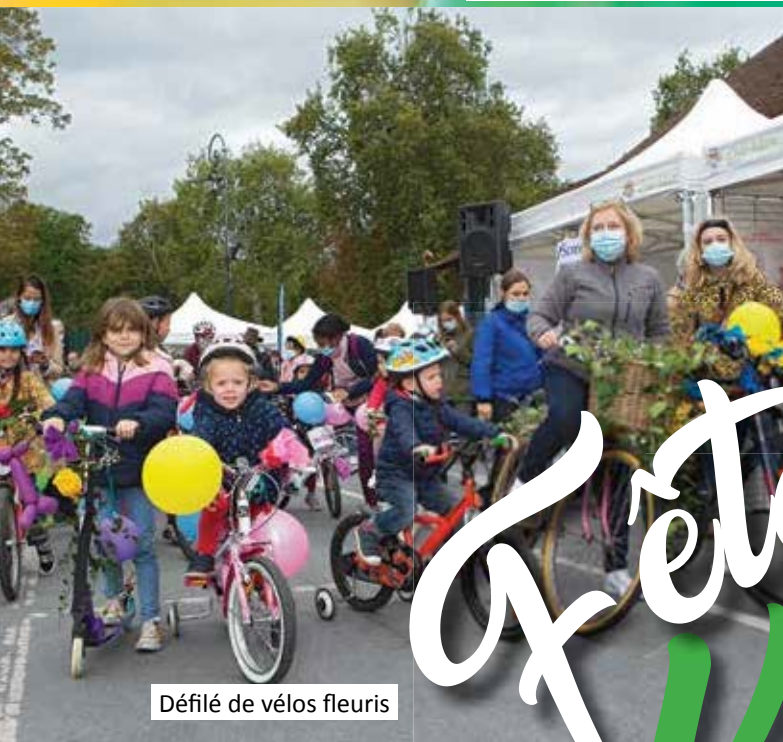
Défilé de vélos fleuris