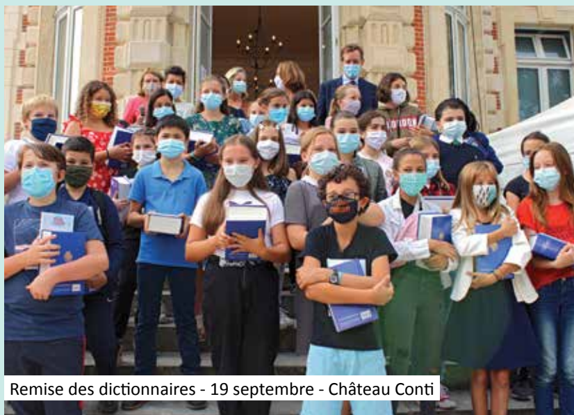
Remise des dictionnaires - 19 septembre - Château Conti