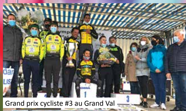
Grand prix cycliste #3 au Grand Val