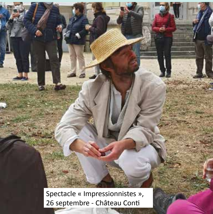
Spectacle « Impressionnistes », 26 septembre - Château Conti