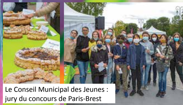
Le Conseil Municipal des Jeunes : jury du concours de Paris-Brest