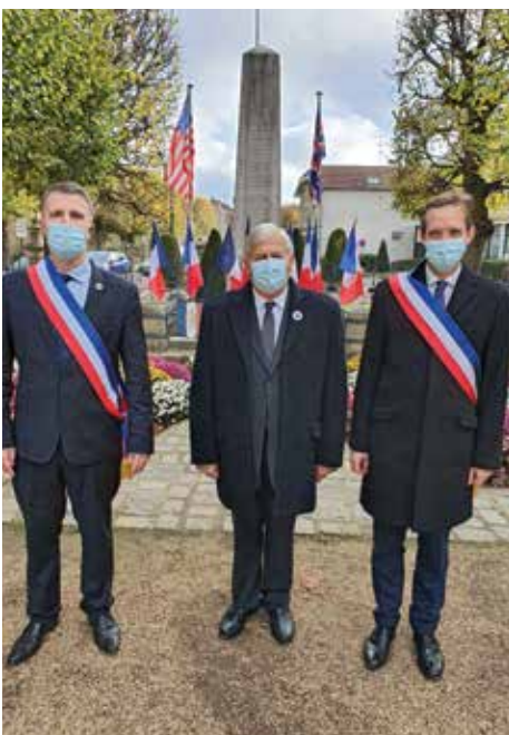
Commémoration du 11 novembre 2020.