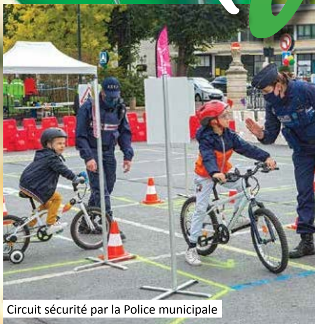
Circuit sécurité par la Police municipale