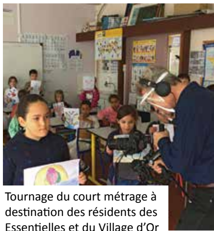
Tournage du court métrage à destination des résidents des Essentielles et du Village d'Or

Les seniors ont également profité d'ateliers de loisirs créatifs comme la confection de bijoux ou la poterie avec de l'argile sans cuisson mis en place par le Comité des Fêtes.