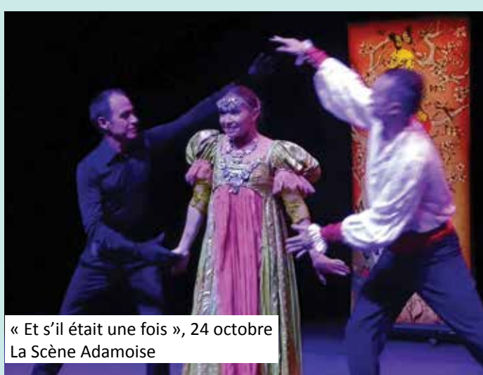
« Et s'il était une fois », 24 octobre La Scène Adamoise