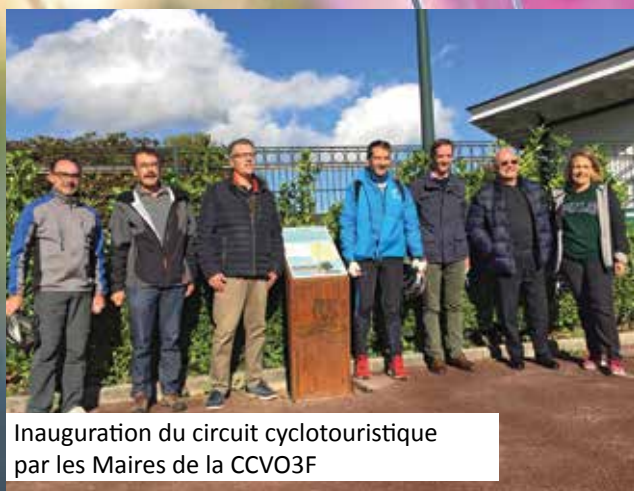
Inauguration du circuit cyclotouristique par les Maires de la CCVO3F