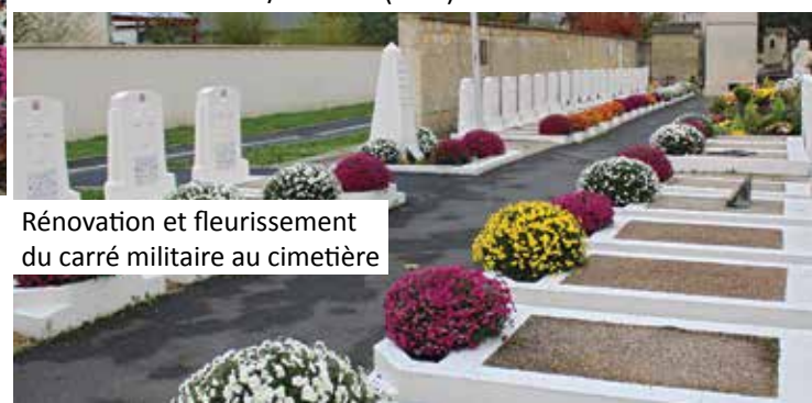
Rénovation et fleurissement du carré militaire au cimetière

Deux monuments aux morts situés dans la forêt domaniale, en hommage aux résistants assassinés par les Allemands en 1944, ont été rénovés en partenariat avec l'Union Nationale des Combattants, section L'Isle-Adam/Parmain (UNC).