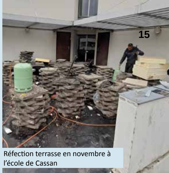
Réfection terrasse en novembre à l'école de Cassan

Dans le cadre du plan de relance, un diagnostic énergétique complet de l'ensemble des bâtiments, et en priorité des écoles, sera lancé en 2021. Les objectifs : définir où sont les failles dans l'isolation thermique et avoir une vue d'ensemble des performances énergétiques afin de tendre vers des structures communales les plus éco-responsables possibles.