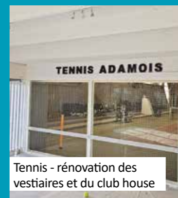
Tennis - rénovation des vestiaires et du club house