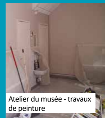
Atelier du musée - travaux de peinture