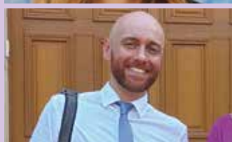
Monsieur Pierre Rivals Inspecteur de l'Education nationale du Val d'Oise