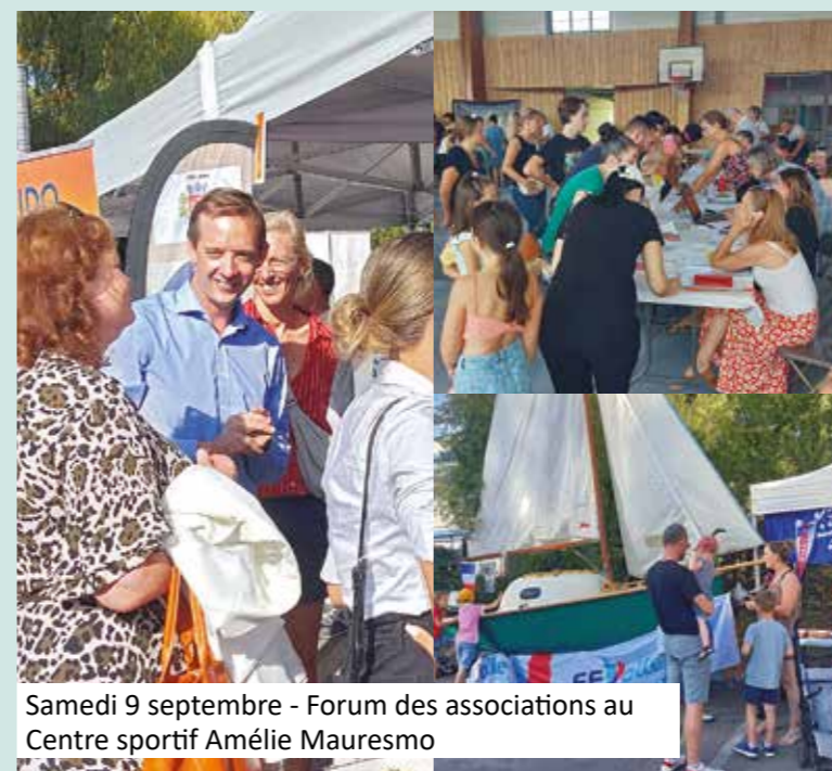
Samedi 9 septembre - Forum des associations au Centre sportif Amélie Mauresmo