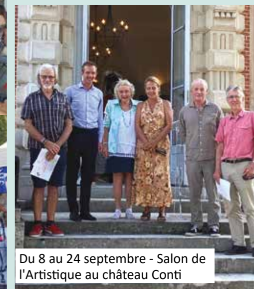
Du 8 au 24 septembre - Salon de l'Artistique au château Conti