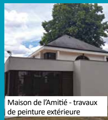
Maison de l'Amitié - travaux de peinture extérieure