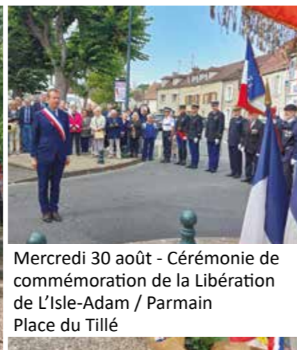
Mercredi 30 août - Cérémonie de commémoration de la Libération de L'Isle-Adam / Parmain Place du Tillé