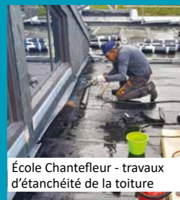
École Chantefleur - travaux d'étanchéité de la toiture