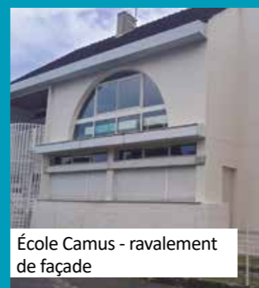
École Camus - ravalement de façade