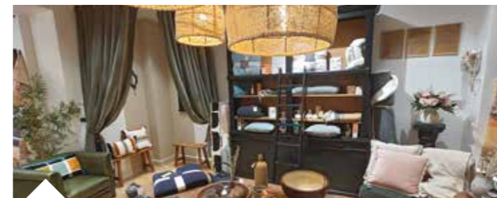
Décoration - Suzanne Home-Wear 10 rue Saint-Lazare