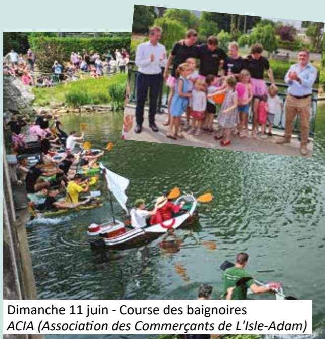
Dimanche 11 juin - Course des baignoires ACIA (Association des Commerçants de L'Isle-Adam)