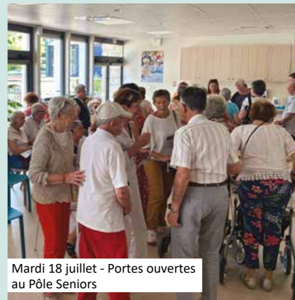
Mardi 18 juillet - Portes ouvertes au Pôle Seniors