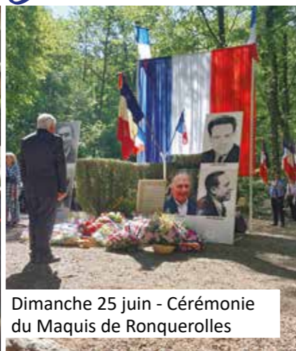
Dimanche 25 juin - Cérémonie du Maquis de Ronquerolles