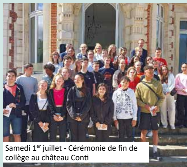
Samedi 1 er juillet - Cérémonie de fin de collège au château Conti