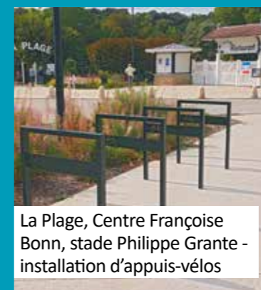
La Plage, Centre Françoise Bonn, stade Philippe Grante - installation d'appuis-vélos