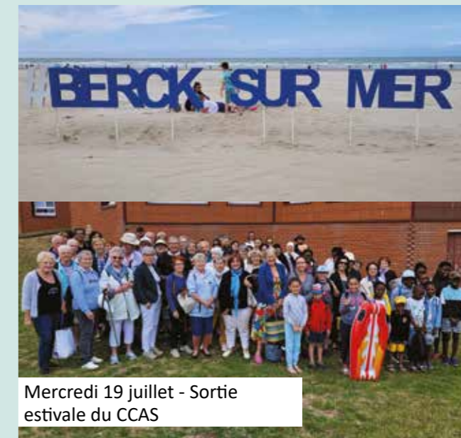
Mercredi 19 juillet - Sortie estivale du CCAS