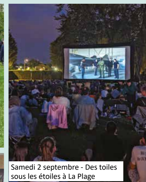
Samedi 2 septembre - Des toiles sous les étoiles à La Plage