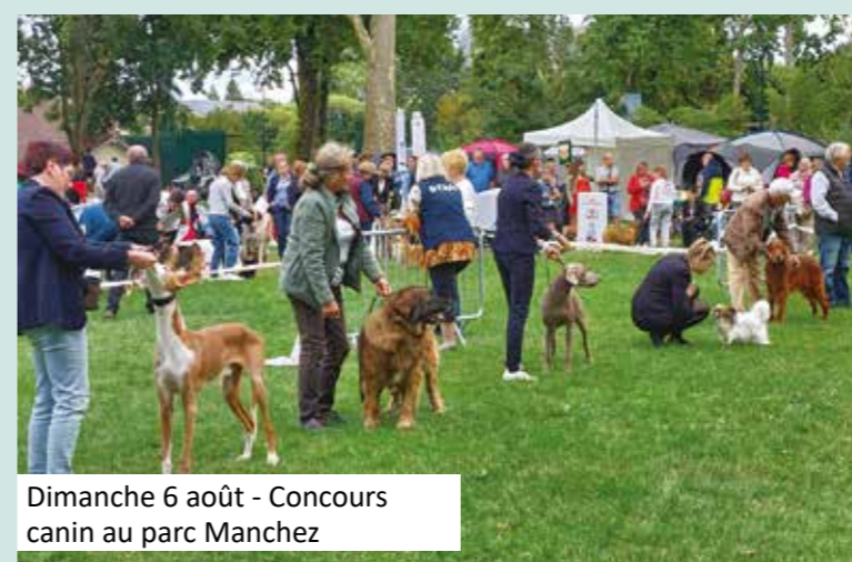
Dimanche 6 août - Concours canin au parc Manchez