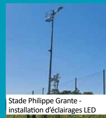
Stade Philippe Grante - installation d'éclairages LED