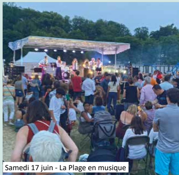
Samedi 17 juin - La Plage en musique