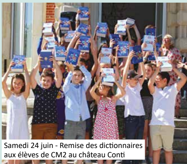
Samedi 24 juin - Remise des dictionnaires aux élèves de CM2 au château Conti