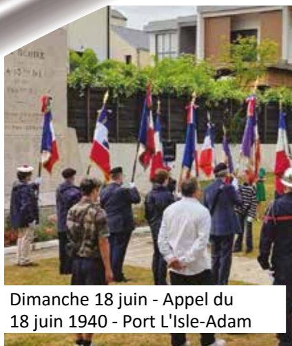
Dimanche 18 juin - Appel du 18 juin 1940 - Port L'Isle-Adam