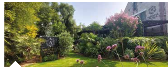
Hôtel - restaurant - Amicitia Chemin Pierre Terver