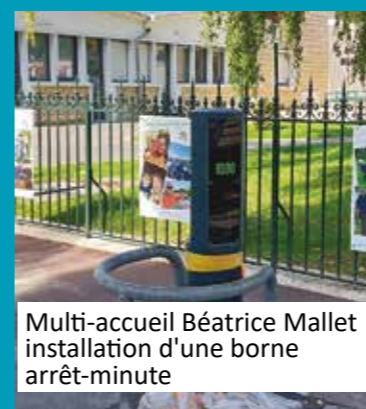
Multi-accueil Béatrice Mallet installation d'une borne arrêt-minute