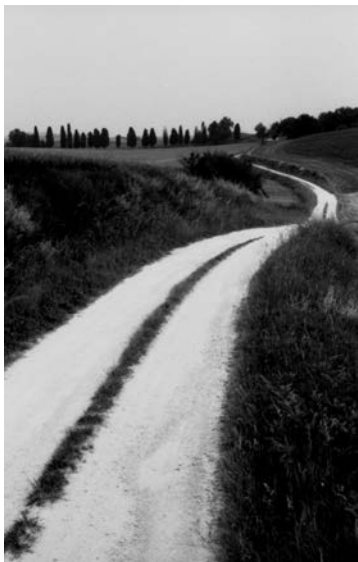
Olivier Verley Variation sur le S de sentier, Gers, mars 1994, 18 heures Photographie argentique