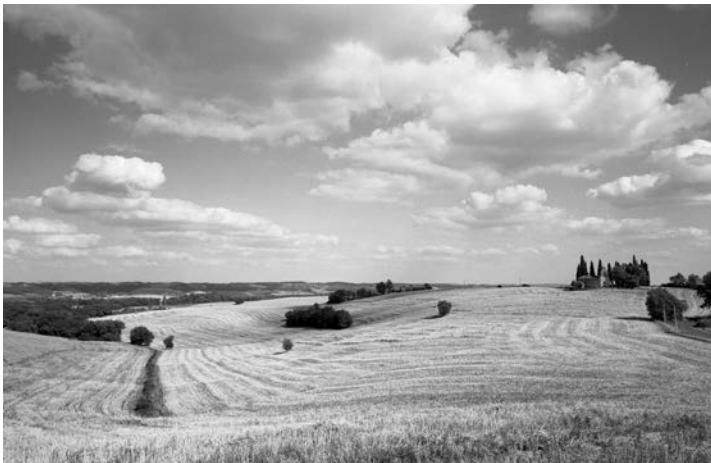
Olivier Verley La Chapelle isolée, Gers, 6 juin 2000, 16 heures Photographie argentique

Cette exposition sera également l'occasion de montrer le travail qu'Olivier Verley a entrepris dans le Gers entre 1993 et 1996.