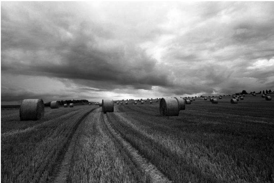
3. Olivier Verley Cormeilles-en-Vexin, 12 août 2001, 18 heures Photographie argentique