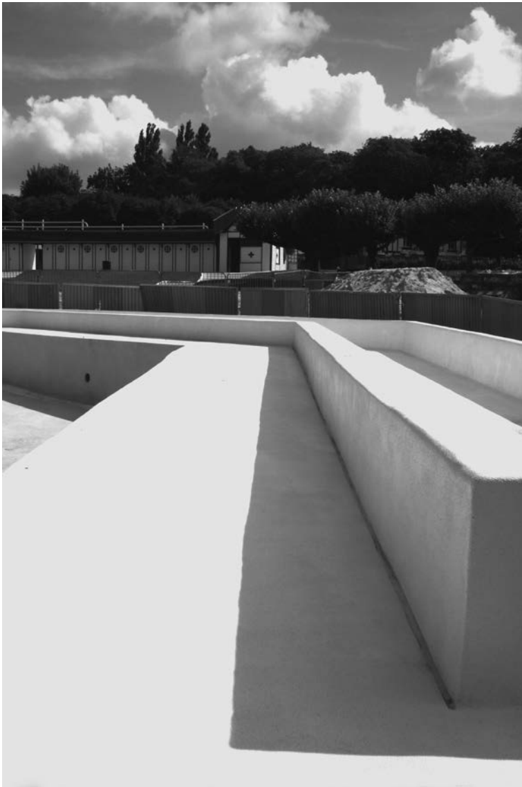
6. Olivier Verley Méry-sur-Oise, inondations, mars 2001 Photographie argentique