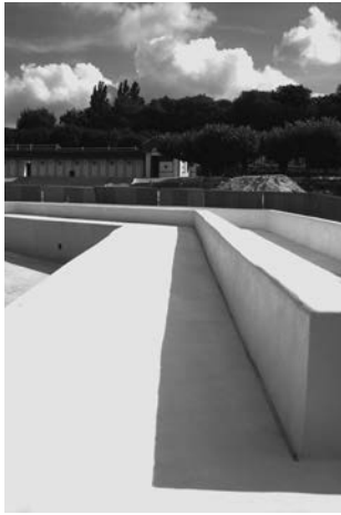
Olivier Verley L'Isle-Adam, la Plage, août 2016 Photographie numérique