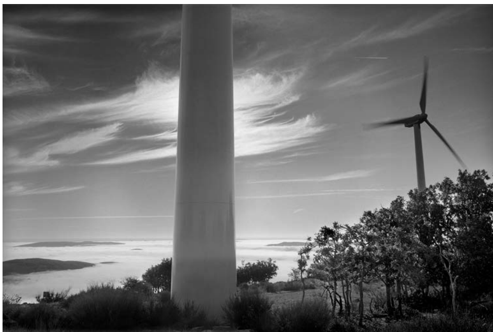
12. Olivier Verley Éoliennes, Castille, mai 2008, 16 heures Photographie argentique