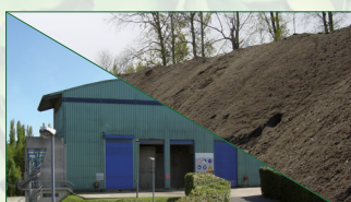
Usine de compostage des déchets ménagers