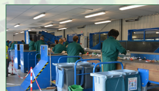
Centre de tri