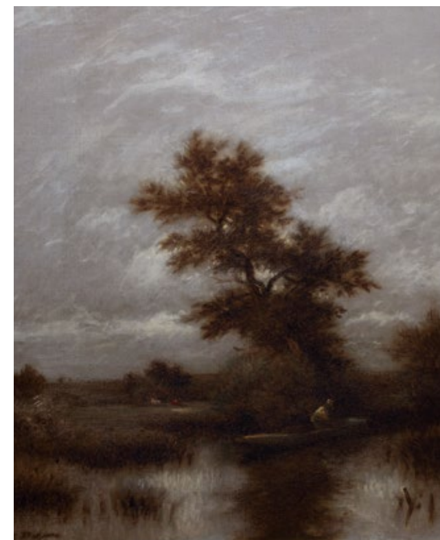
Jules Dupré (1811-1889) Chaumière à L'Isle-Adam Non datée, huile sur toile