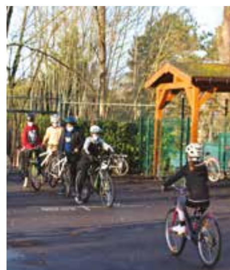
Programme « Savoir pédaler » École Cassan

*L’ULIS est une classe qui a pour mission d’accueillir de façon différenciée des élèves en situation de handicap.