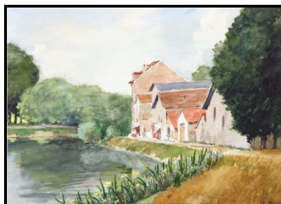
Quai de l'Oise – Le Pâtis