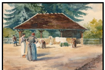
Ancien lavoir à l'emplacement de la Mairie