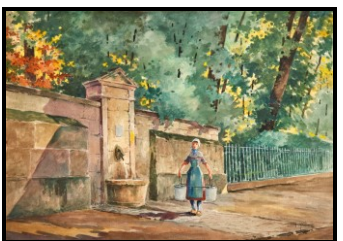
Fontaine des Ecuries de Conti