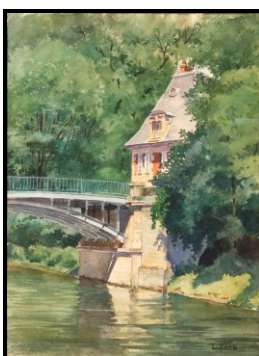
Pont du Moulin et pavillon Conti