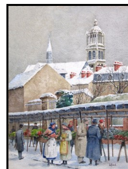
Marché avenue des Ecuries de Conti