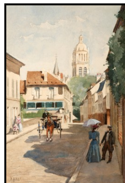
Eglise et Mairie