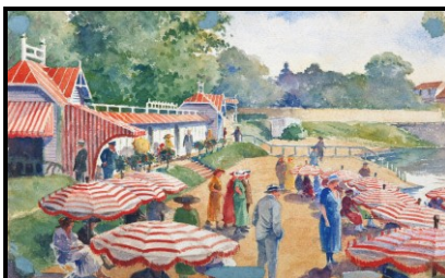
La Plage années 1930