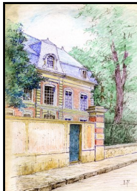
Ancien hôtel Bergeret Aujourd'hui le musée