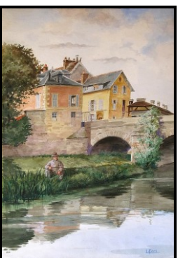
Pêcheur sous le pont du Cabouillet