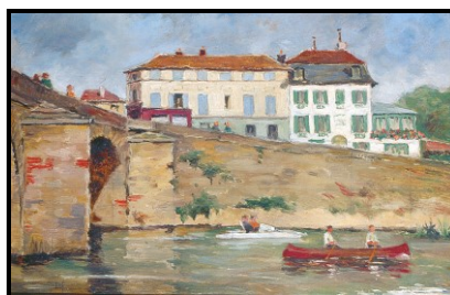
Pont et restaurant du Cabouillet