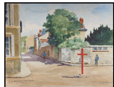
Rue de la Croix Rouge