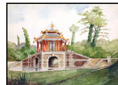
Le Pavillon chinois

Le plan joint vous permettra de les situer. Belle balade à travers la ville.