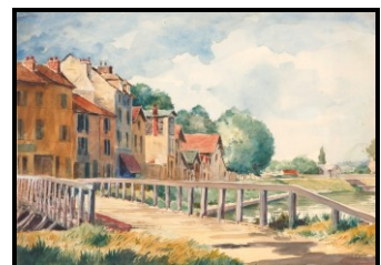
Passerelle sud et maisons du Pâtis