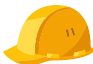
Sécurité et prévention