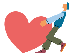
Santé et solidarité