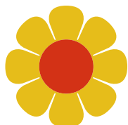
Cadre de vie et espaces verts

Ces projets seront à 100 % financés et réalisés par la commune. Les projets sélectionnés doivent participer à l'amélioration du cadre de vie.