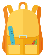
Enfance, jeunesse et éducation