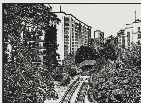
Ariane Fruit La petite ceinture # 5 2009 Linogravure 50 x 60 cm