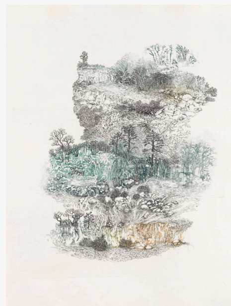
Caroline Bouyer, Aux confins du monde I , 2019 Impression taille-douce, dessin à la plume, 56 x 76 cm

Les arbres se déploient ici en bosquets ou en forêts plus denses et se parent de tonalités, tantôt ocres brunes, tantôt vertes bleutées, leurs silhouettes s'effaçant parfois en présences fantomatiques.