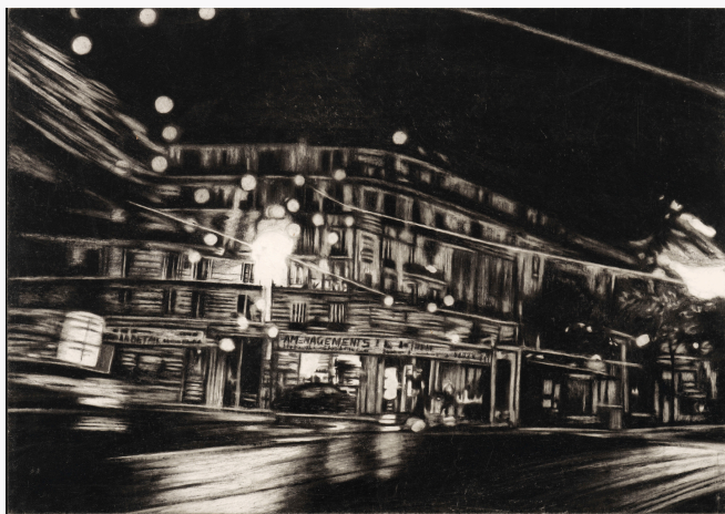
Ariane Fruit, Nocturnes (taxi #3) , 2011 Crayon marqueur, 35 x 50 cm

Les gravures de Caroline Bouyer, qu'elle qualifie elle-même de « témoignages graphiques », révèlent les transformations du XIIIe arrondissement, les multiples visages du périphérique parisien, mais aussi la puissance monstrueuse de l'industrie métallurgique du nord de la France.