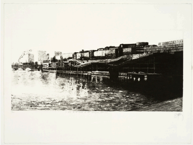
Caroline Bouyer, Cité de la mode et du design, Paris XIIIe 2011, Carborundum et pointe sèche, 33 x 69 cm

Le musée d'Art et d'Histoire Louis-Senlecq a réuni pour cette exposition plus d'une centaine d'œuvres gravées et dessinées par Caroline Bouyer et Ariane Fruit.