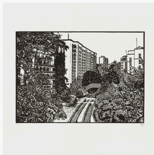
Ariane Fruit La petite ceinture # 5 2009 Linogravure 50 x 60 cm