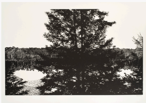
Ariane Fruit, Transe canadienne VII , 2020, Gravure sur bois, 70 x 100 cm

Transe canadienne est une série de 17 gravures sur bois réalisée en 2022 par Ariane Fruit, dont 10 sont présentées dans l'exposition. Inspirée par les paysages observés depuis le train « Le Canadien », reliant Toronto à Vancouver, la série transpose l'expérience du voyage ferroviaire dans le champ de la gravure. Les matrices, réalisées au format 70 x 100 cm, reprennent les dimensions des fenêtres du train, établissant un rapport direct entre le cadre du regard, le déplacement et l'espace de la représentation.