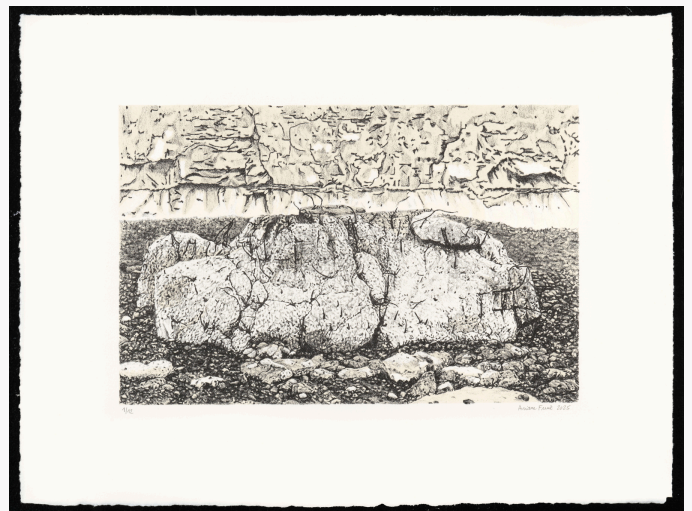
Ariane Fruit, Marée basse 2 , 2025, Lithographie, 30 x 40 cm

La gravure sur bois, ou xylogravure, est une technique de dessin sur bois à l'aide d'un burin ou d'une gouge. Le graveur creuse un dessin sur une plaque de bois qui est ensuite enduite d'encre puis appliquée contre une feuille à l'aide d'une presse. Le dessin est alors reproduit à l'envers sur la feuille. La gravure sur bois est par ailleurs l'une des plus anciennes techniques d'imprimerie connue, elle apparaît dès le XIVe siècle.